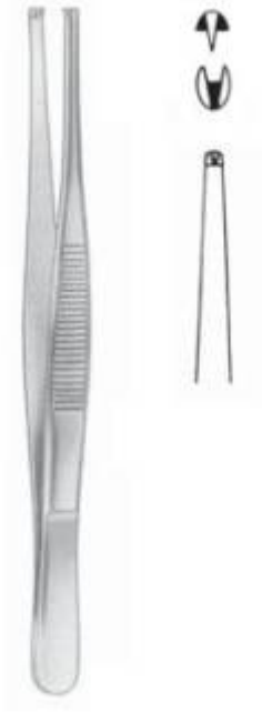
Pinza de disección ADSON sin dientes 2